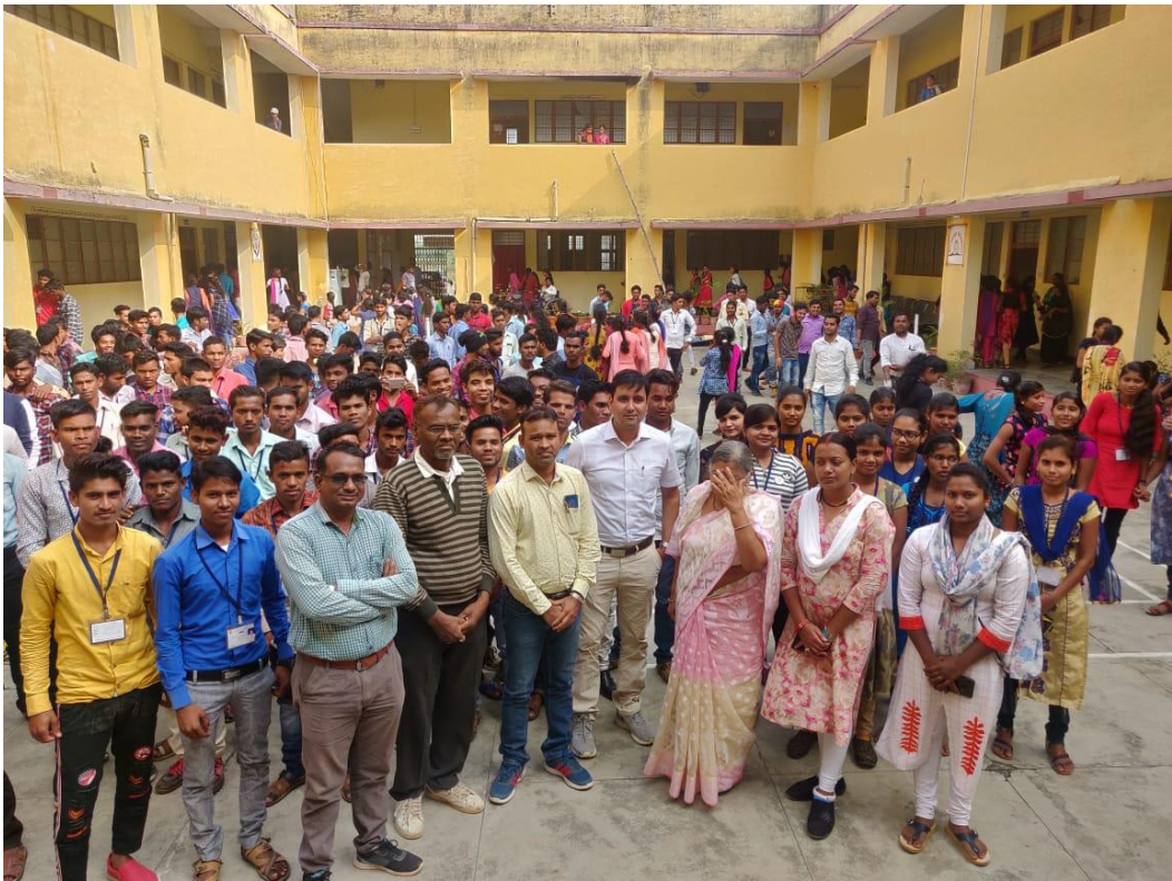
ADDRESS BY WOMEN CELL- RAKSHA TEAM OF DISTRICT POLICE BALODA BAZAR