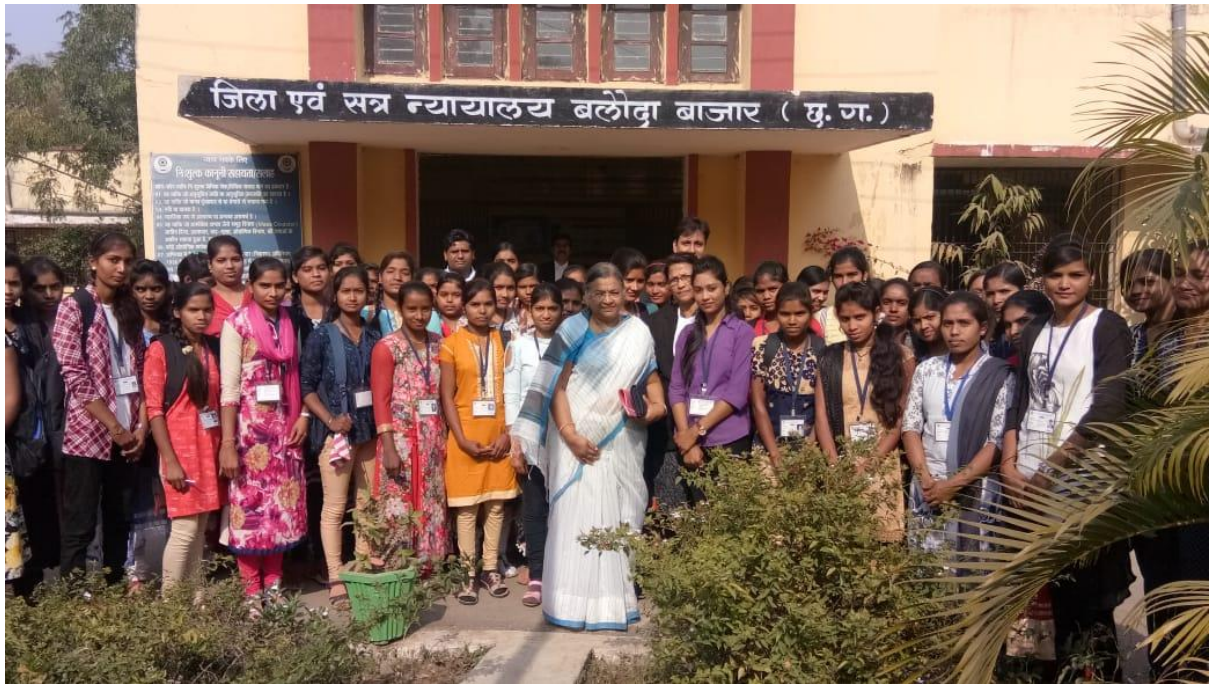
WOMEN CELL – VISIT TO DISTRICT AND SESSIONS COURT BALODA BAZAR 08/01/2019